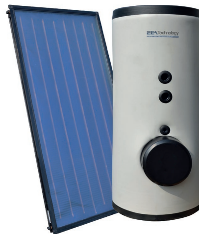
Collettore EPS e Bollitore EBF