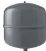
Vaso di espansione