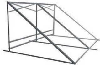
Supporto per collettori