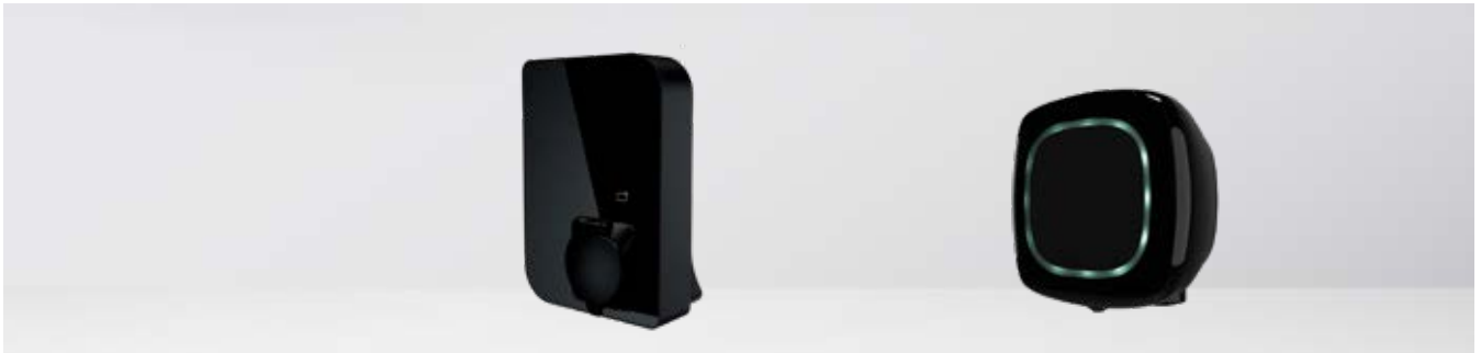
Stazione di ricarica Commerciale