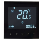
Comando touchscreen optional