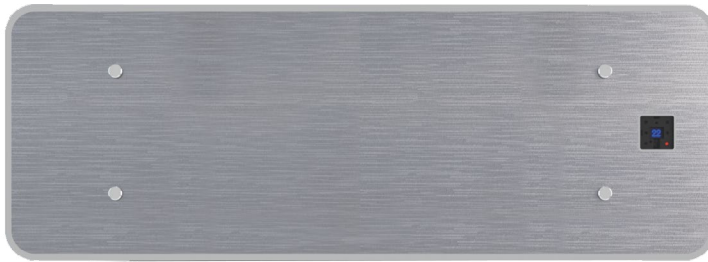
Parete idronico XHW