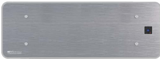
Mural hydronique XHW