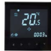
Commande écran tactile en option