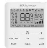
Comando a filo (optional)